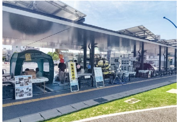
「第4回水都大垣かわまちテラス 耐震・防災ブース」参加

「第3回水都大垣かわまちテラス 耐震・防災ブース」参加 日 時 令和6年4月6・7日(土・日) 会 場 大垣市役所駐車場会場 参加者 2名