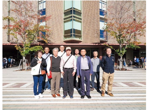
石川県立図書館 集合写真