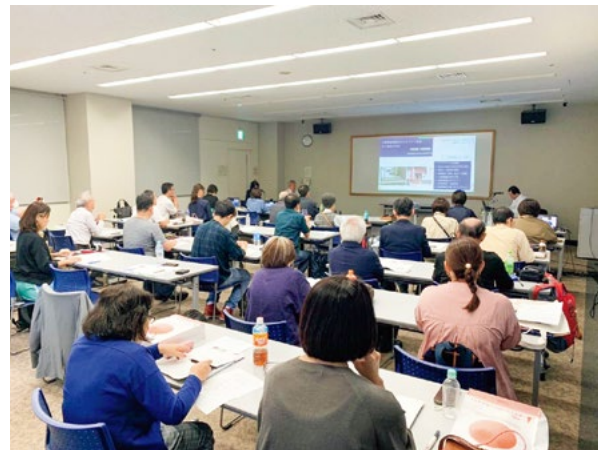
福祉まちづくりセッション参加の様子