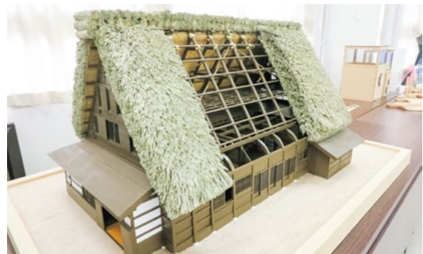
(6年度士会会長賞作品)