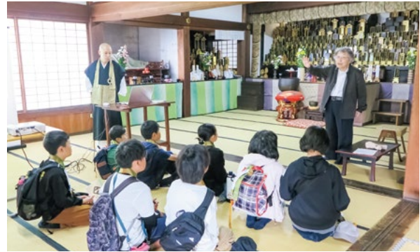
(お寺での説明の様子)