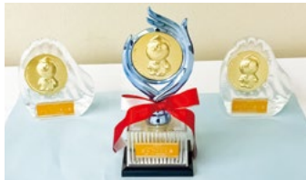
(建築士会より副賞)