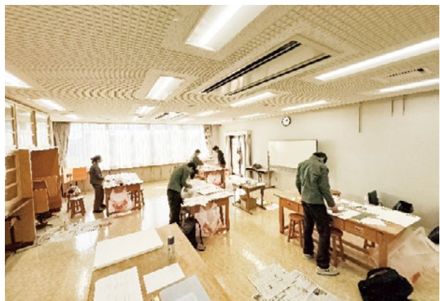
住宅模型作成教室