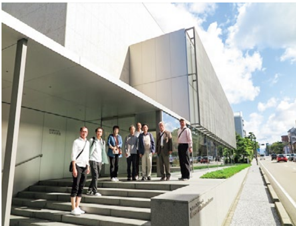
谷口吉郎・吉生記念金沢建築館 集合写真